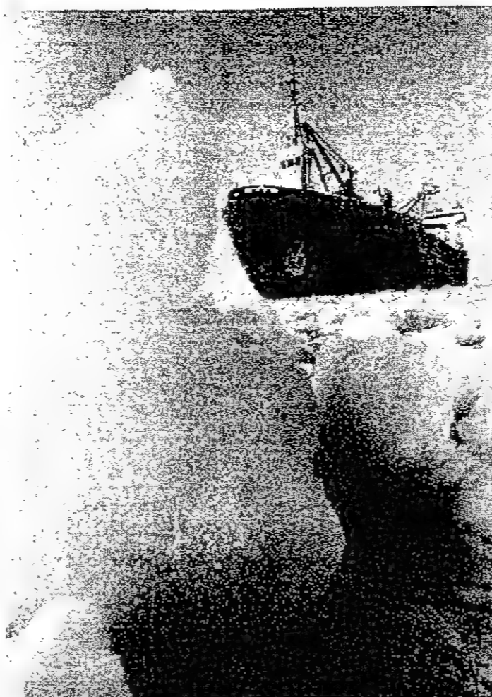
بأخرة «ارخانغليكس» تبحر في حقل جليدي.